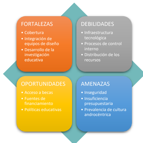
Figura 3. Matriz FODA.

La comunidad universitaria ha analizado y reflexionado los logros del cumplimiento de las metas del POA 2022, además se problematizaron las fortalezas, debilidades, necesidades y los retos de cada una de las Unidades, Subsedes y Extensiones, desde la perspectiva de los actores involucrados en los procesos académicos y administrativos. En la siguiente figura se muestra el análisis FODA para la UPES.