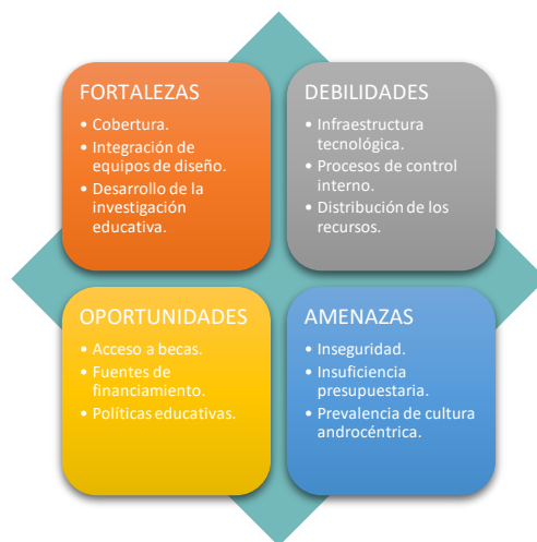
Figura 3. Matriz FODA.

La comunidad universitaria ha analizado y reflexionado los logros del cumplimiento de las metas del POA 2022, además se problematizaron las fortalezas, debilidades, necesidades y los retos de cada una de las Unidades, Subsedes y Extensiones, desde la perspectiva de los actores involucrados en los procesos académicos y administrativos. En la siguiente figura se muestra el análisis FODA para la UPES.